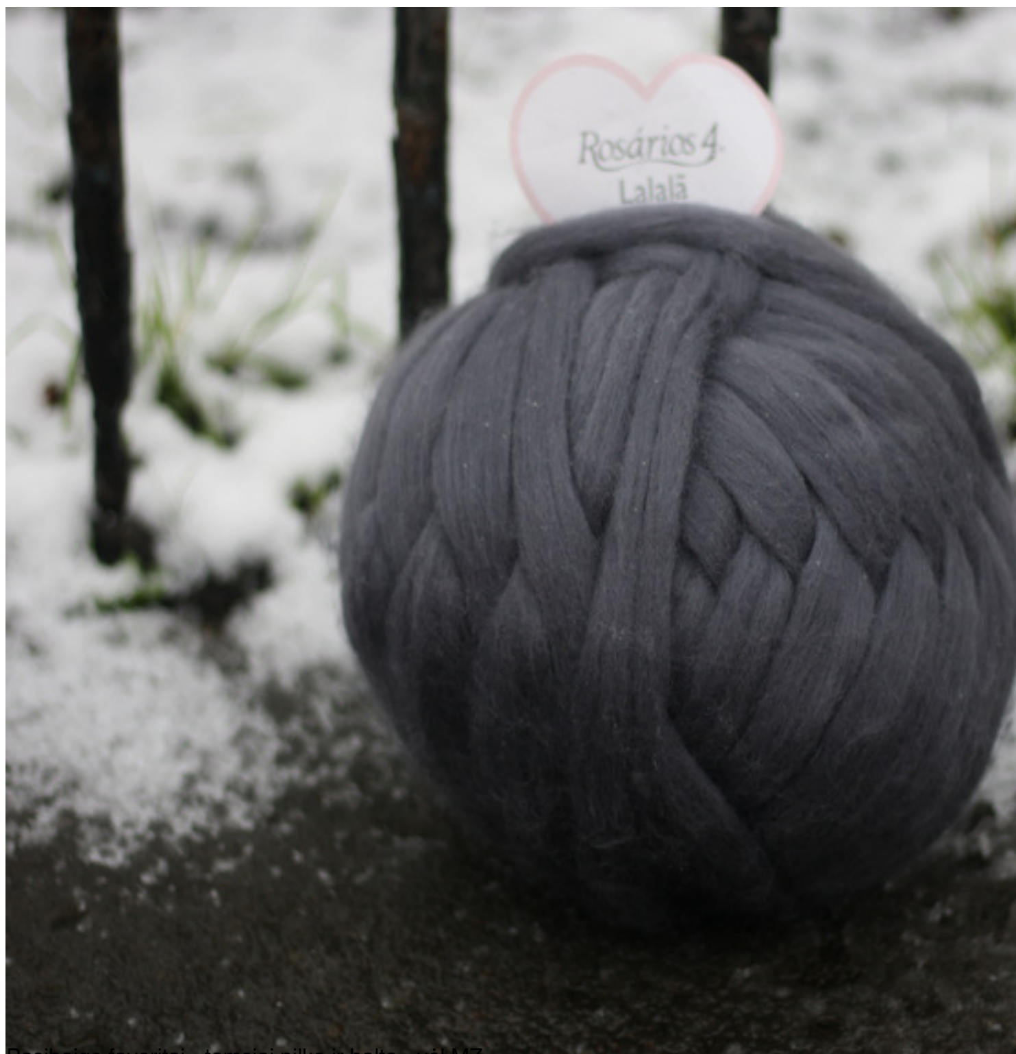
Pasibaigę favoritai - tamsiai pilka ir balta - vėl MZ.